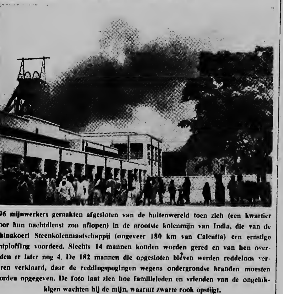
196 mijnwerkers geraakten afgesloten van de buitenwereld toen zich (een kwartier voor hun nachtdienst zou aflopen) in de grootste kolonmijn van India, die van de Chhakoeri Steenkolenmaatschappij (ongeveer 180 km van Calcutta) een ernstige ontploffing voerde. Slechts 14 mannen konden worden gered en van hen overleden er later nog 4. De 182 mannen die opgesloten bleven werden reddeloos verloren verklaard, daar de reddingspogingen wegens ondergrondse branden moesten worden opgegeven.